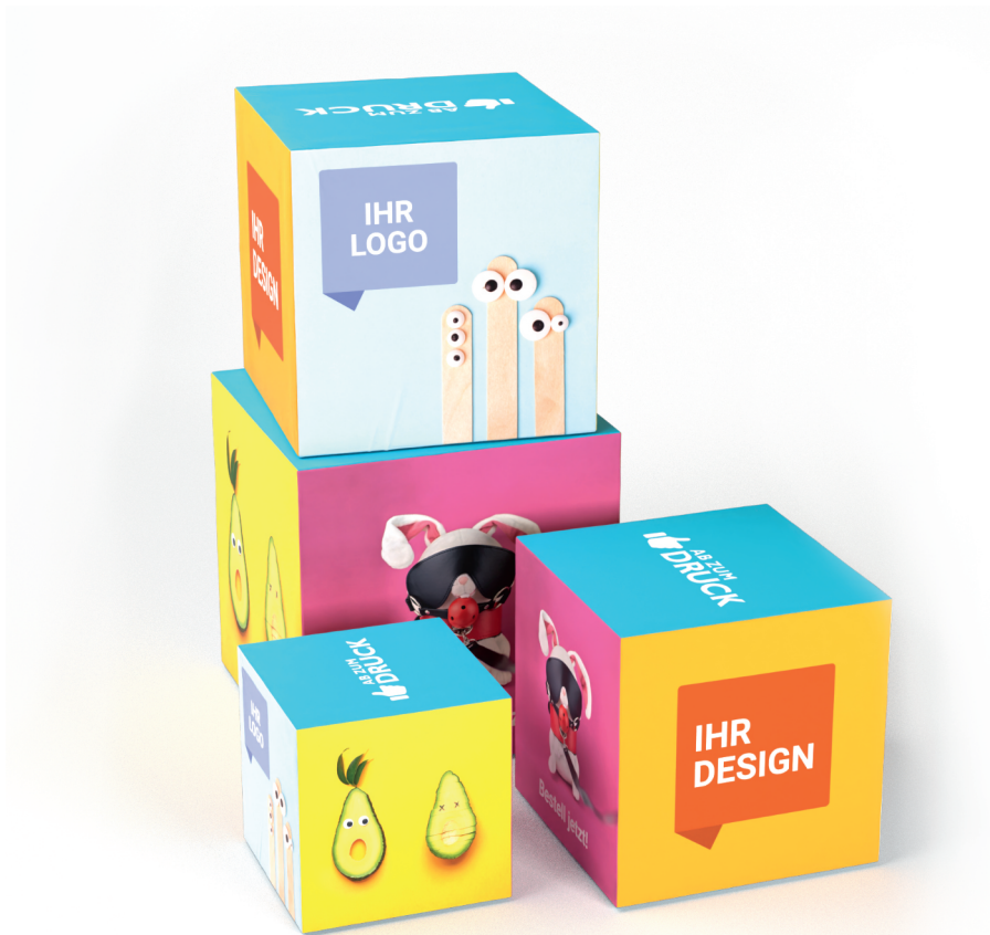
Teil B (gedreht)